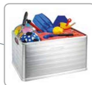
Viel Platz für diverse Gegenstände

Die Alukiste hat im Laufe der Jahre immer mehr Liebhaber gewonnen, da Aluminium leicht, stabil, temperaturbeständig, robust, rostfrei und hygienisch sowie lebensmittelgeeignet ist. Für eine Kiste, egal für welchen Zweck, ob als Transportkiste oder als Stapelkiste für die persönliche Aufbewahrung, gibt es keine bessere Alternative als die Alukiste – von Ottawa S mit 30 Litern Inhalt bis zu Ottawa XXL mit 120 Litern Inhalt.