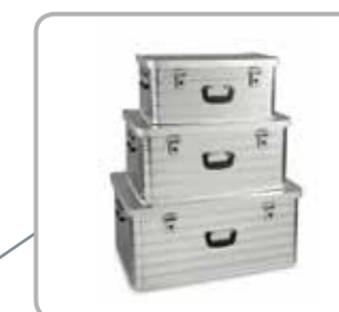
Aufeinander und ineinander stapelbar