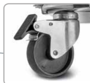
Zubehör: Einsetzbare Rollen für den noch leichteren Transport