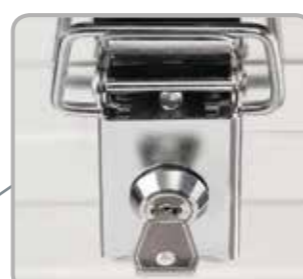
Zubehör: Einsetzbares Steckschloss