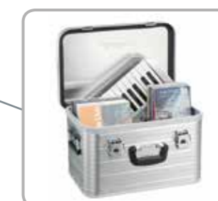
Viel Platz für diverse Gegenstände