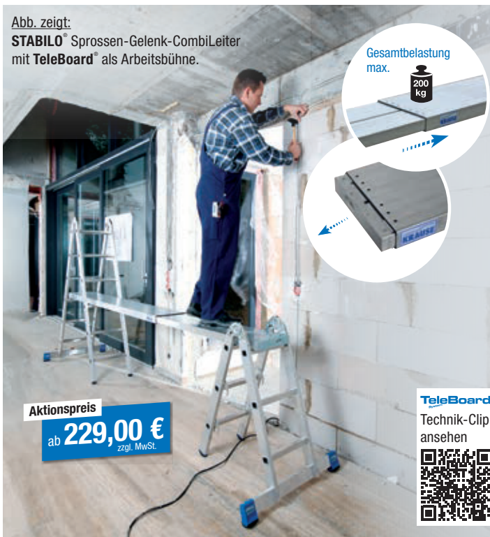
Abb. zeigt: STABLO Sprossen-Gelenk-CombiLeiter mit TeleBoard® als Arbeitsbühne.